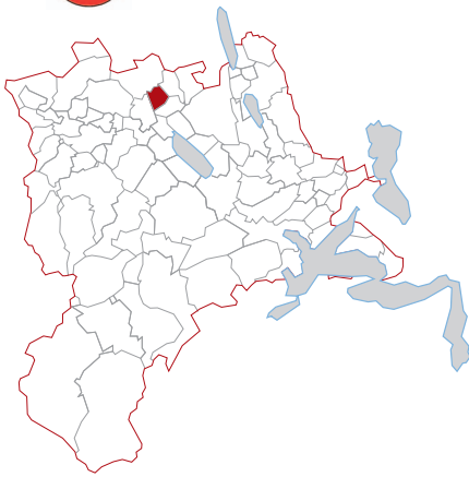
Blick auf die Gemeinde Büron