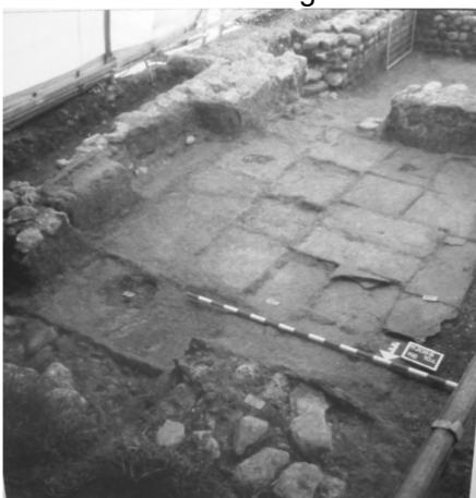
Ausgrabungen von 1997