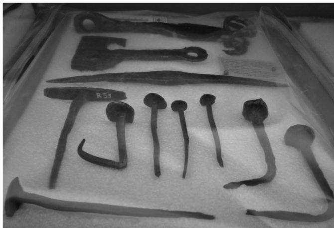
Die Fundstücke werden im Historischen Museum Luzern aufbewahrt

Der Verein steht allen offen, die sich für die Geschichte von Büron interessieren. Neue Mitglieder sind herzlich willkommen.