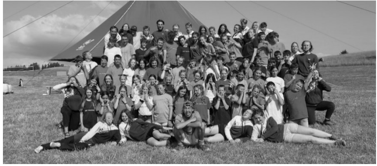
Gruppenfoto vom Sommerlager 2023 in Grenchen