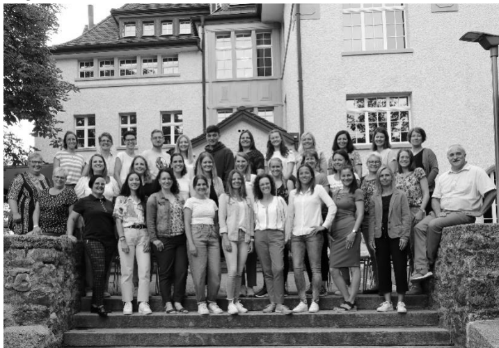
Team Büron SJ 22-23 mit den Praktikanten

Schliesslich freuen wir uns immer wieder, wenn wir Ehemalige als Stellvertretungen oder sogar als Lehrpersonen bei uns wissen oder durch sie einfach gute Kontakte zur jungen Generation an der PH Luzern oder in der Berufswelt haben.