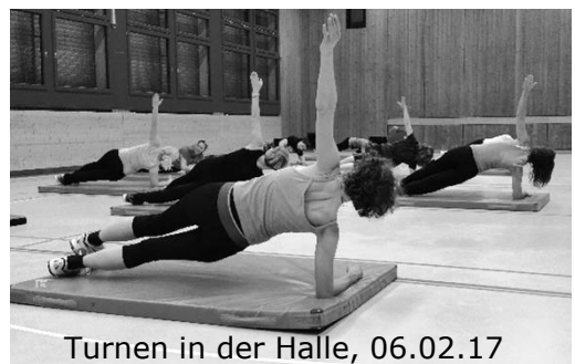
Turnen in der Halle, 06.02.17